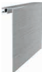
ALUMINIO EFEECTO ACERO INOXIDABLE PULIDO Código: 02