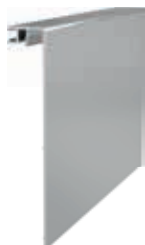
ALUMINIO ANODIZADO Código: 01